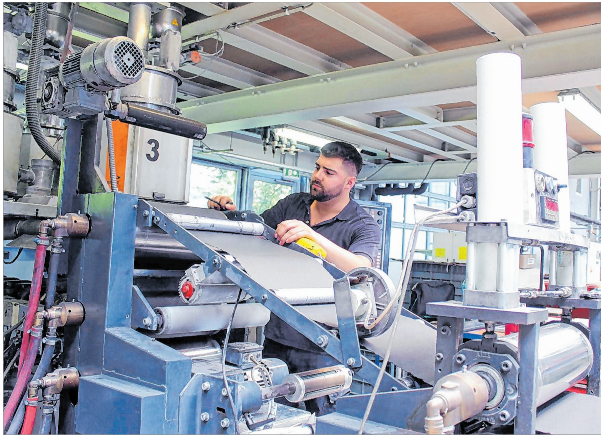
Genauigkeit und Präzision sind bei der Anfertigung von Brandschutzmaterialien gefragt. Die meisten Waren, die das Unternehmen produziert, sind individuell auf Kundenwünsche abgestimmt.