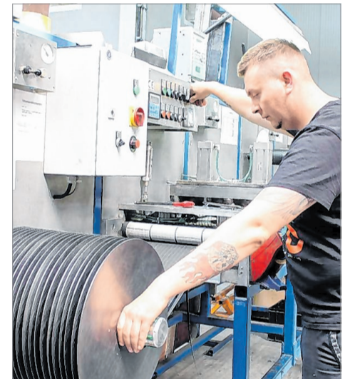
Egal ob auf Spulen oder am Stück – technisch ist vieles möglich.