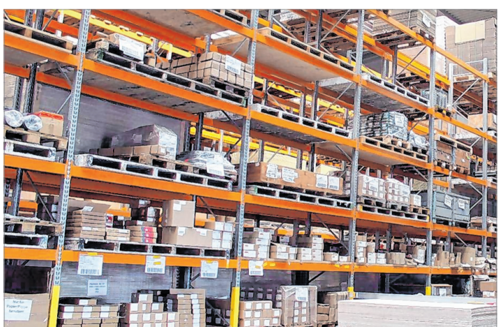
Die Versandhalle der Rolf Kuhn GmbH in Schameder bietet viel Raum – Lagerhaltung allerdings ist eher selten.

Dort im Industriepark sind außerdem Labors für Entwicklung und Untersuchung von Stoffen installiert. „Ein Brand an sich ist nicht kontrollierbar, aber man kann die