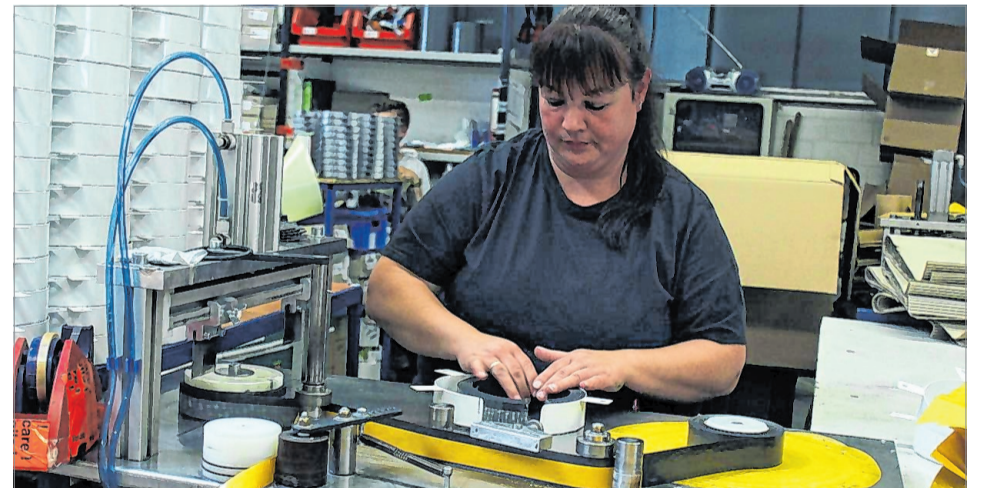
Das Gros der Fertigungsschritte erfordert ein geschultes Auge der Mitarbeiter. Daran ändert auch der digitale Wandel hin zur vielzitierten Industrie 4.0 nichts.