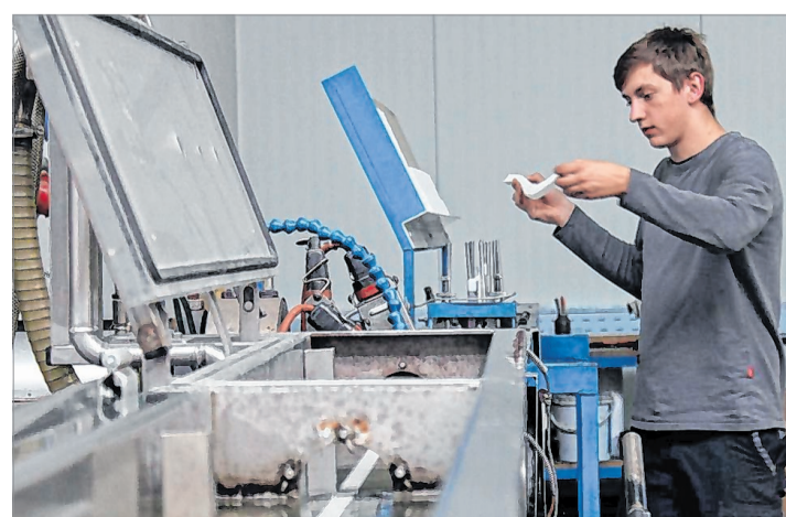
Bis die Materialien tatsächlich fertiggestellt sind, durchlaufen sie mehrere Produktionsschritte und Behandlungen.