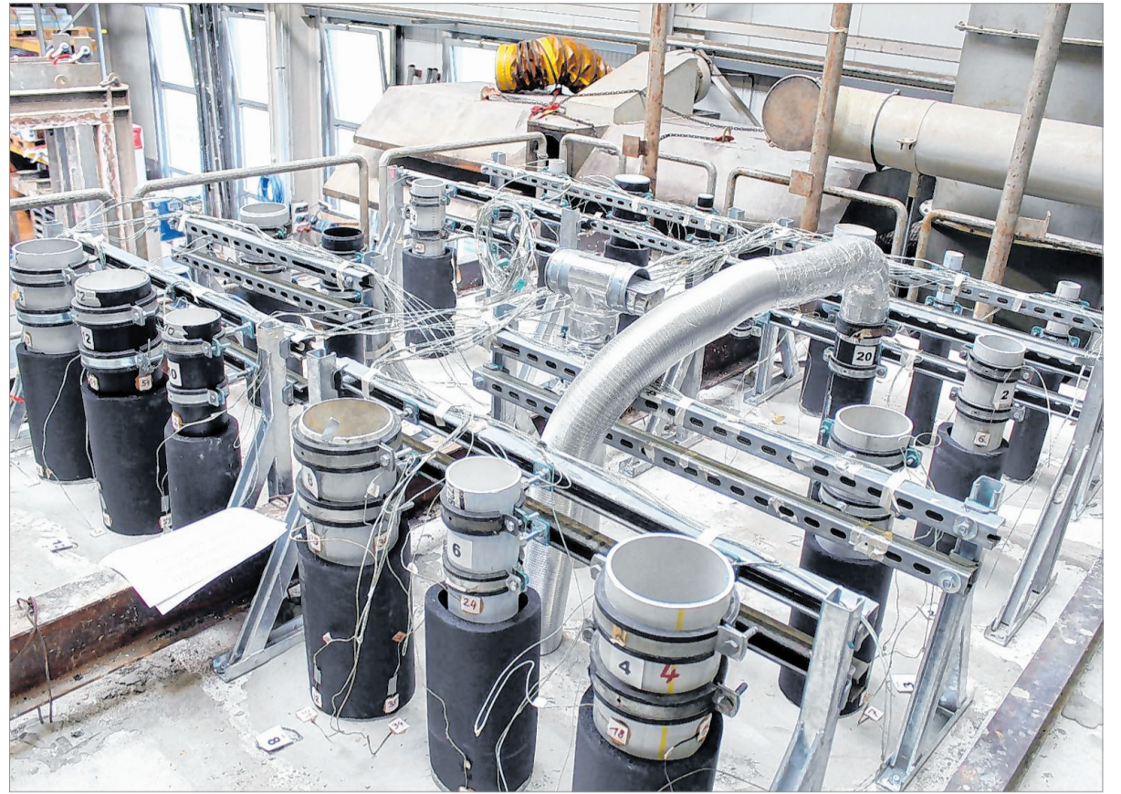
In den Prüfföfen im Prüf- und Technikzentrum im Industriepark Wittgenstein nehmen die Produkte eine der letzten und entscheidenden Hürden – bestehen sie den Test, erfolgt eine entsprechende Zertifizierung.