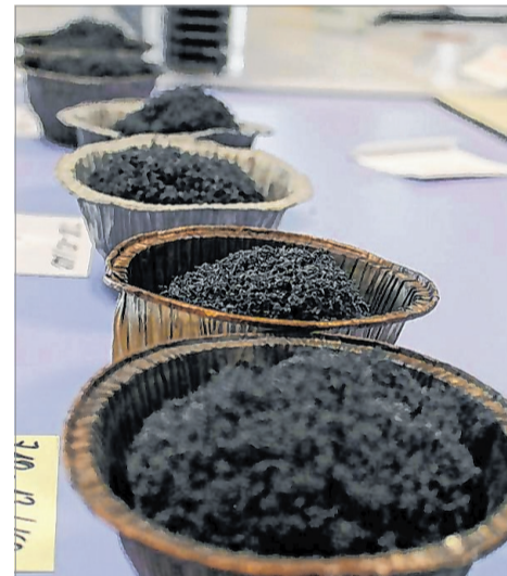
Intumeszierende Materialien sind eingehend im eigenen Labor geprüft.