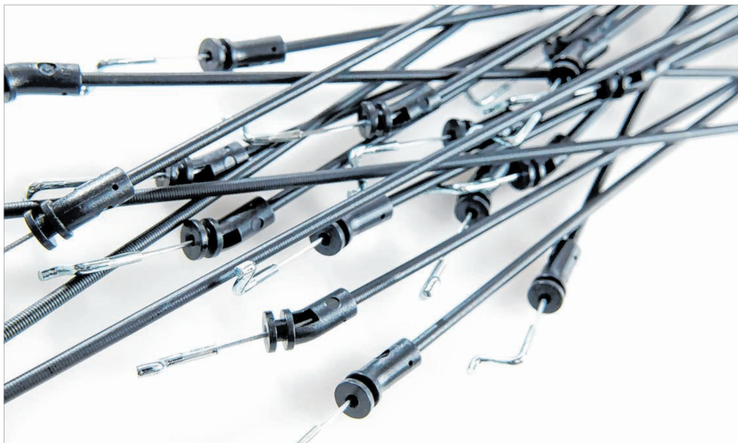
Heute produziert die Stahlschmidt Cable Systems GmbH und Co. KG ganze Systeme mit Bowdenzügen und Federn. Die Marktbearbeitung und die Produkt- und Produktionsentwicklung ist am SCS-Stammsitz in Berghausen beheimatet.