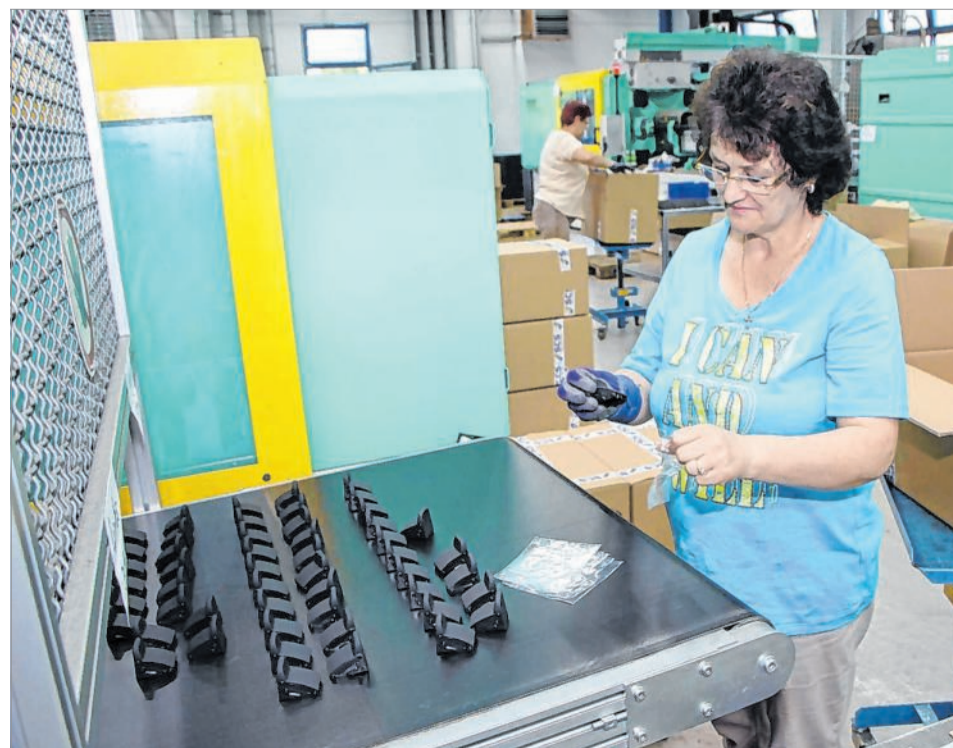
In Berghausen hat das Unternehmen auch die Sparte mit Kunststoffteilen ausgebaut. Die jüngsten Investitionen flossen in die Anschaffung neuer Maschinen.