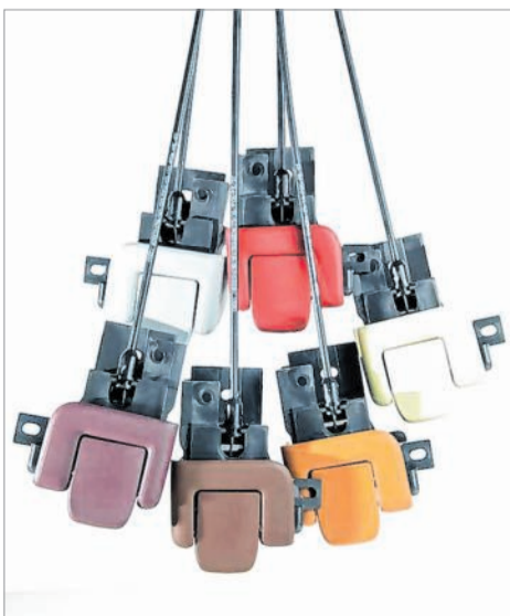
Bei den automotiven Sitzapplikationen ist SCS stark vertreten.