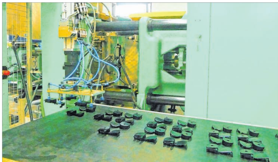
Am Stammsitz der SCS-Gruppe in Berghausen reihen sich die Produktionsmaschinen aneinander. Hier arbeiten heute rund 200 Menschen.

SCS ist Entwicklungspartner namhafter Automobil-Hersteller. Die Entwicklung ist am Stammsitz in Berghausen beheimatet, hier werden neue Produkte erdacht, die dann an den europäischen Produktionsstandorten hergestellt werden. Der amerikanische und der asiatische Markt werden