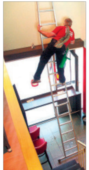
Ganzer Körpereinsatz ist bei der Gebäudereinigung gefragt.