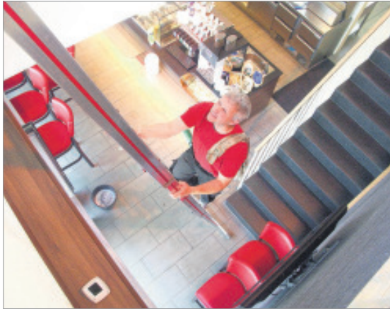
Kein Aufstieg wird gescheut: Folge 6 der SZ-Wirtschaftsserie „Zukunftsvisionen“ stellt den Gebäudereinigungsbetrieb WGR näher vor.