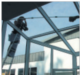
Den Glaspavillon säubert die Unternehmerin mit der Teleskop-Stange.

Über die Jahre sei es ihr schließlich gelungen, ein exponentielles Wachstum zu erreichen. Dies liege in erster Linie an dem breiten Spektrum, das das Reinigungsunternehmen anbiete: Von der Glas- und Unterhaltsreinigung, über Bauschlussreinigung, Schimmelbeseitigung, Hochdruck- und Fassadenreinigung bis hin zu Spezial-