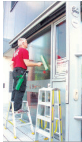
Die Mitarbeiter der WGR sind 24 Stunden, rund um die Uhr, im Einsatz.

Weitere Bilder zum Unternehmen sind übrigens ab kommender Woche in den Räumen der Volksbank Wittgenstein in Bad Berleburg zu sehen.